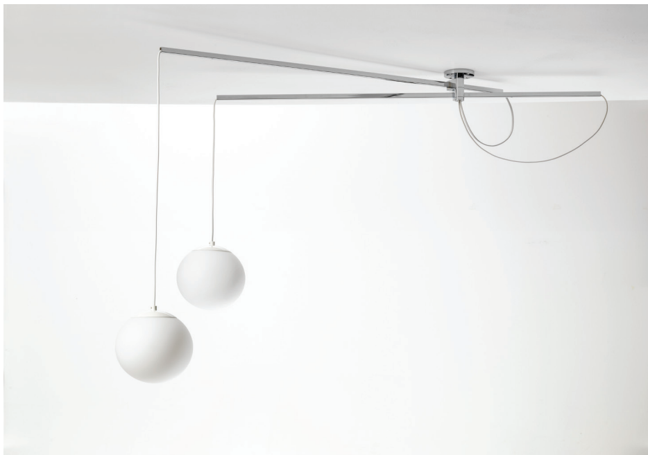
Abb. DRELA, Erst-Edition, Design Willy Guhl 1955