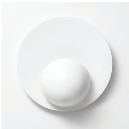
Abb. DOT Halbkugel reinweiss