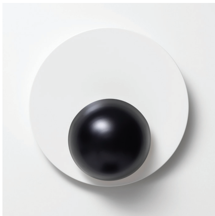
Abb. DOT Halbkugel graphitschwarz