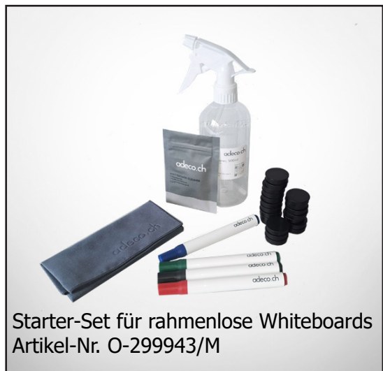
Starter-Set für rahmenlose Whiteboards Artikel-Nr. O-299943/M