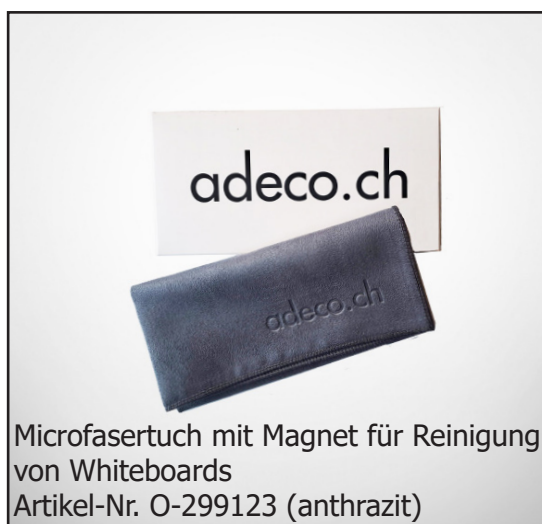
Microfasertuch mit Magnet für Reinigung von Whiteboards Artikel-Nr. O-299123 (anthrazit)