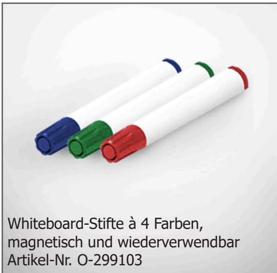
Whiteboard-Stifte à 4 Farben, magnetisch und wiederverwendbar Artikel-Nr. O-299103