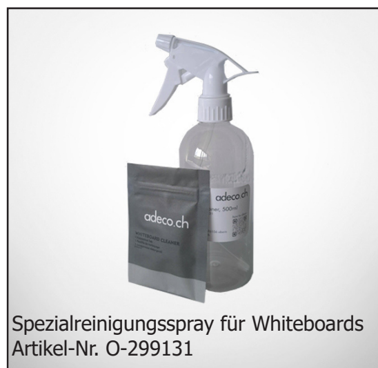
Spezialreinigungsspray für Whiteboards Artikel-Nr. O-299131