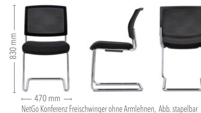
NetGo Konferenz Freischwinger ohne Armlehnen, Abb. stapelbar