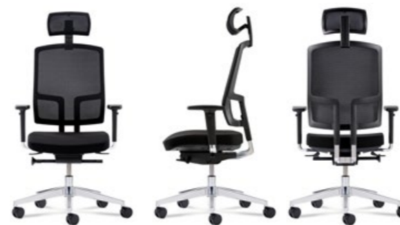
Wahlweise mit Kopfstütze erhältlich