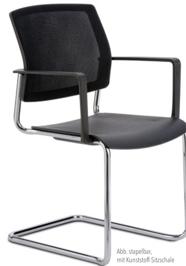
Abb. stapelbar, mit Kunststoff-Sitzschale

Alle Stühle aus dem NetGo-Konferenz-Programm sind auch ohne Polster mit einer stabilen Kunststoff-Sitzschale erhältlich.