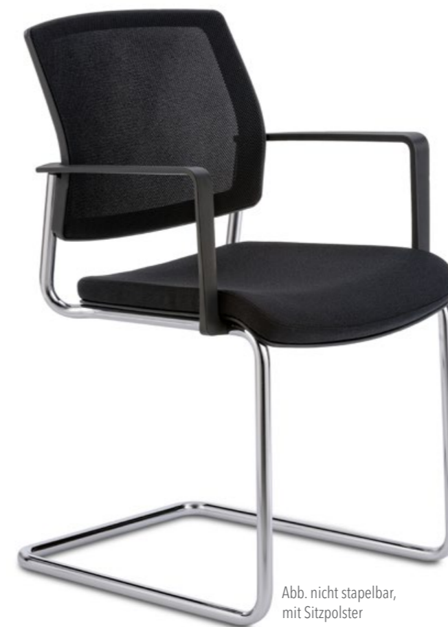
Abb. nicht stapelbar, mit Sitzpolster