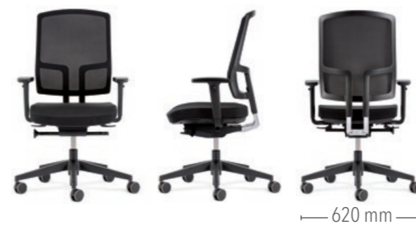
Mit Sitztiefenverstellung und Funktionsarmlehnen (2D) Gestell in Kunststoff schwarz