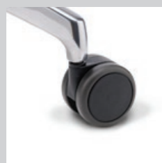
Rollen weich (für harte Böden)