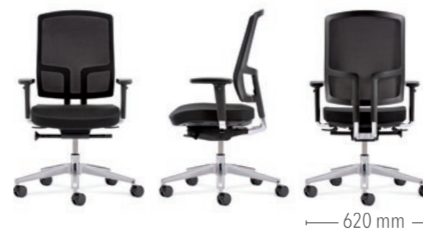
Mit Sitztiefenverstellung und Multifunktionsarmlehnen (3D) Gestell in Aluminium poliert