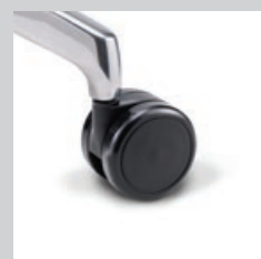
Rollen hart (für Teppich)