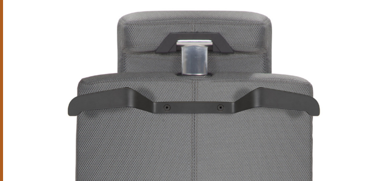
KLEIDERBÜGEL IN SCHWARZ LACKIERTEM ALUMINIUM