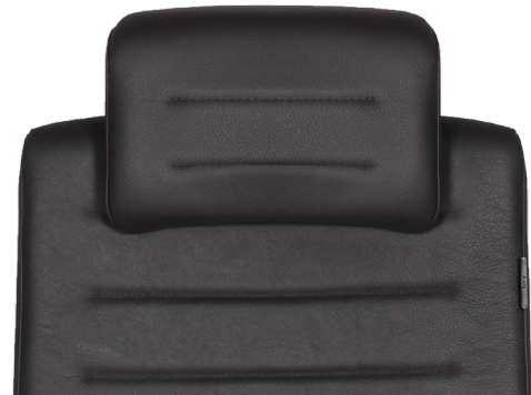
KOPFSTÜTZE MIT STOFF ODER LEDER BEZOGEN