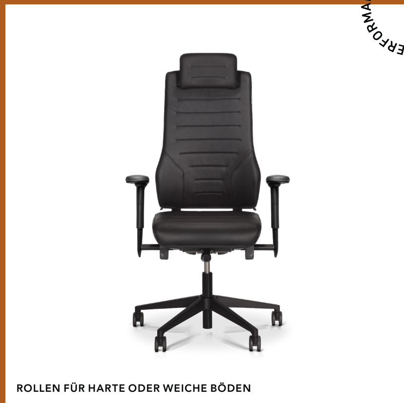
ROLLEN FÜR HARTE ODER WEICHE BÖDEN