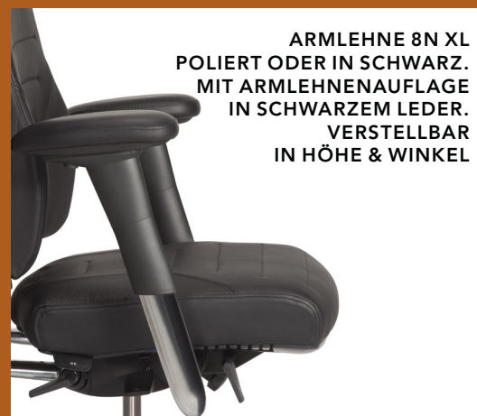
ARMLEHNE 8N XL POLIERT ODER IN SCHWARZ. MIT ARMLEHNENAUFLEGE IN SCHWARZEM LEDER. VERSTELLBAR IN HÖHE & WINKEL