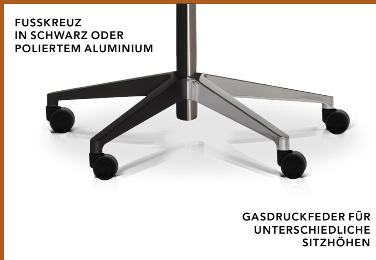
GASDRUCKFEDER FÜR UNTERSCHIEDLICHE SITZHÖHEN

Für den RH Axia Exclusive ist eine Vielzahl von Optionen und Zubehör erhältlich. Weitere Informationen finden Sie in unserer Preisliste.