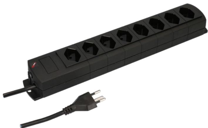
Zuleitung 3 m Typ 12 Câble d'alimentation 3 m type 12