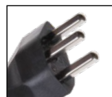
Typ 23 angespritzt Type 23 moulée