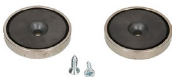
Magnet-Set für Steckdosenleisten Prime Line Typ 13 Ensemble d'aimants pour multiprises Prime Line type 13