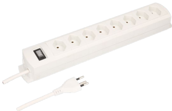
Zuleitung 5 m Typ 12 Câble d'alimentation 5 m type 12