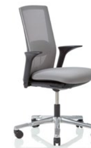
HÅG Futu 1100* mesh FutuKnit mesh Stone – MEH101