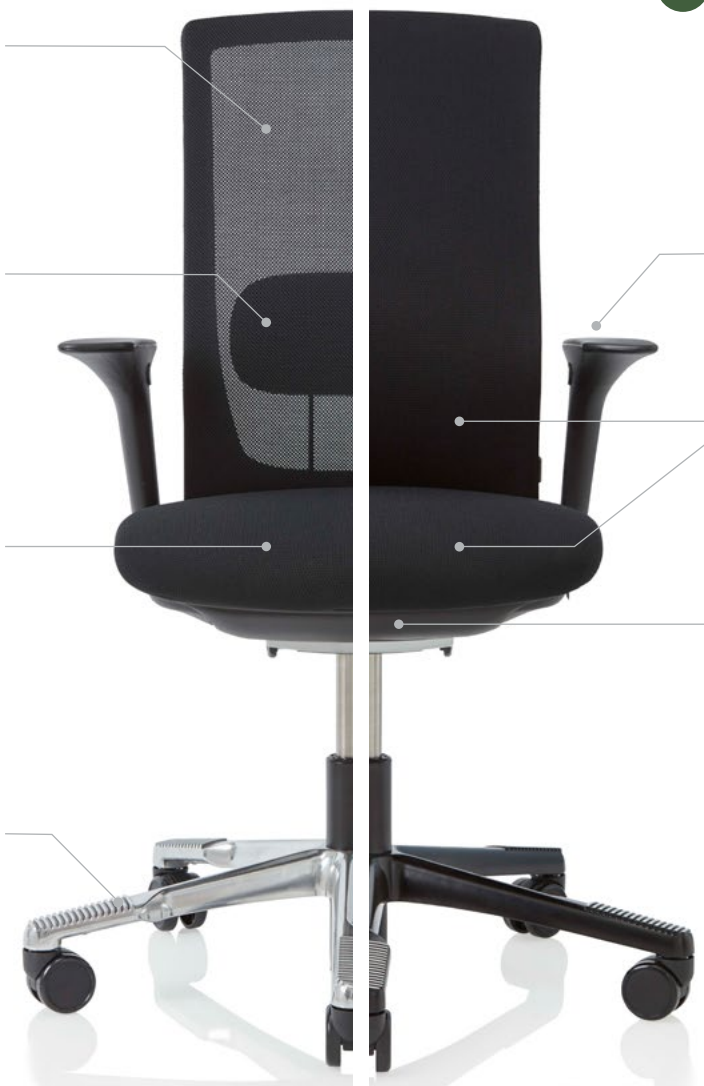
HÅG Futu 1100 mit FutuKnit mesh Rückenlehne

Fusskreuz Die einzigartigen Auflageflächen des Fusskreuzes bieten optimalen Halt und verhindern das Abrutschen der Füße. Dies unterstützt Sie bei der Nutzung der fussgesteuerten HÅG in Balance® Mechanik. Der Wechsel der Fussposition stimuliert die Blutzirkulation.