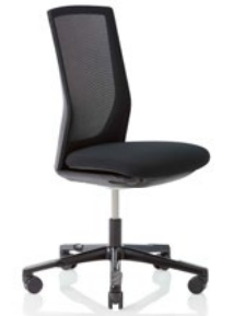
HÅG Futu 1102** Comm. mesh FutuKnit mesh Night – MEH099

Optionales Zubehör auf Wunsch: Armlehnen *Optionales Zubehör auf Wunsch: Lordosenstütze **Erhältlich mit fünfarmigem Fußkreuz