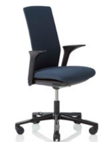
HÅG Futu 1200 solid FutuKnit solid Dusk – FTU102