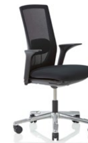
HÅG Futu 1100* mesh FutuKnit mesh Night – MEH099