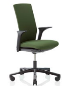
HÅG Futu 1200 solid FutuKnit solid Forest – FTU104