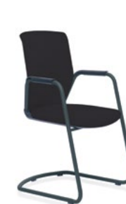
HÅG Futu 1070 Comm. FutuKnit solid Night – FTU099