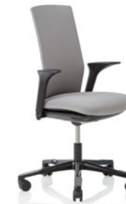
HÅG Futu 1200 solid FutuKnit solid Stone – FTU101