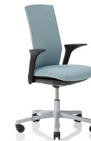
HÅG Futu 1200 solid FutuKnit solid Frost – FTU100