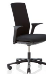
HÅG Futu 1200 solid FutuKnit solid Night – FTU099