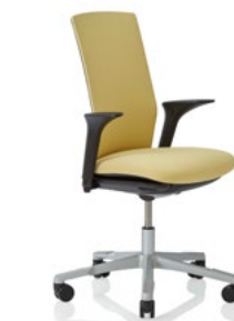
HÅG Futu 1200 solid FutuKnit solid Straw – FTU105