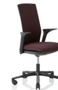
HÅG Futu 1200 solid FutuKnit solid Aubergine – FTU103