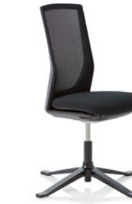
HÅG Futu 1102 Comm. mesh FutuKnit mesh Night – MEH099