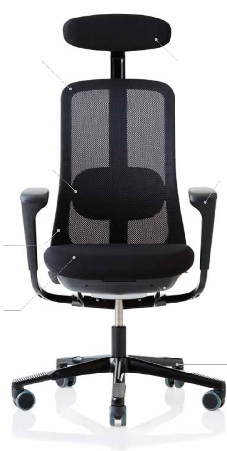
HÅG SoFi 7500 mit Netzrücken ↑

Die Auflageflächen des Fußkreuzes erlauben einen dynamischen Wechsel der Fußposition und stimulieren dadurch Blutfluss und Bewegung.