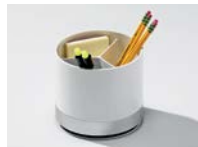
KOMPLETT MIT STIFTEHALTER