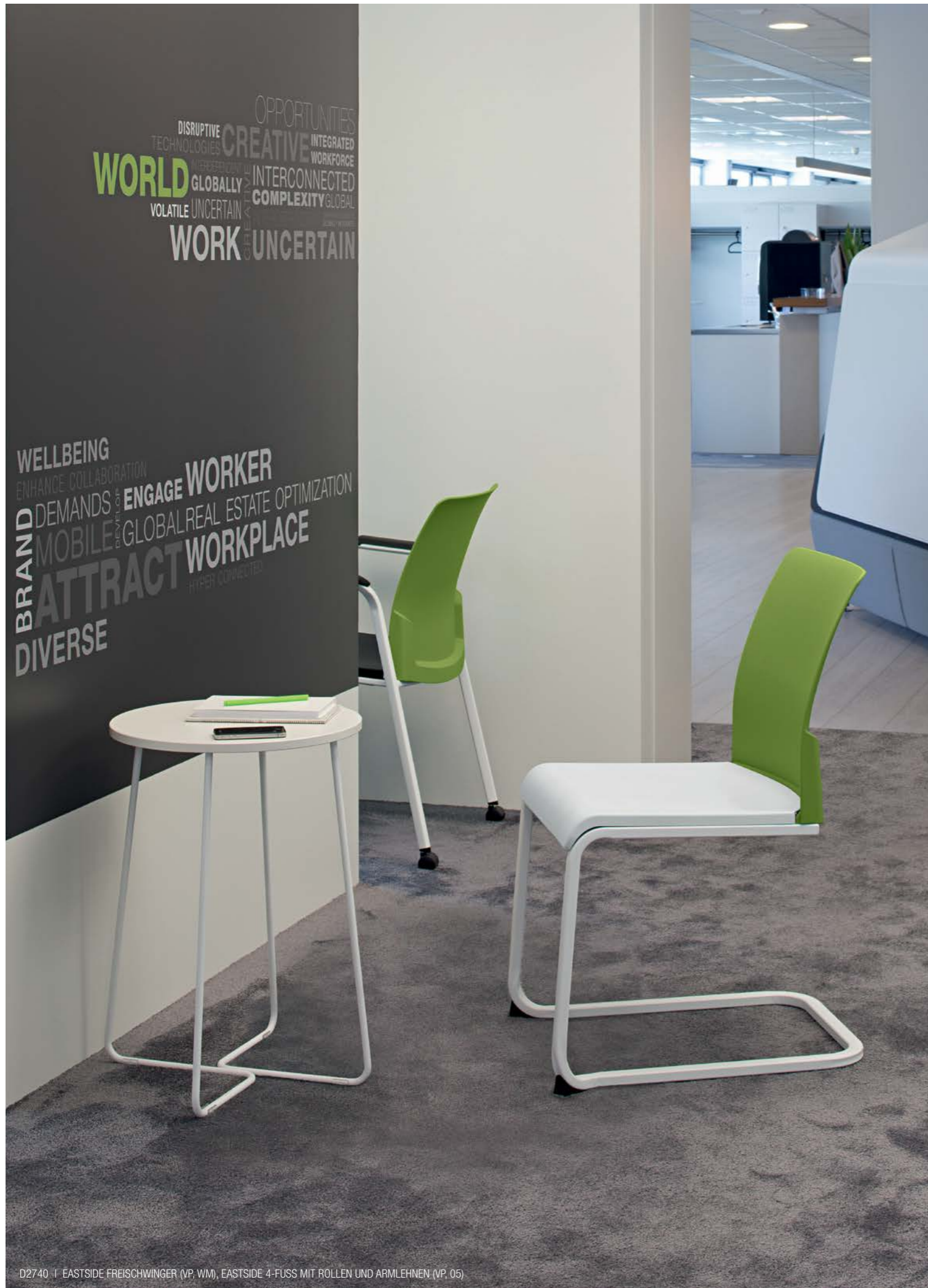
D2740 | EASTSIDE FREISCHWINGER (VP, WM), EASTSIDE 4-FUSS MIT RÖLLEN UND ARMLEHNEN (VP, 05)