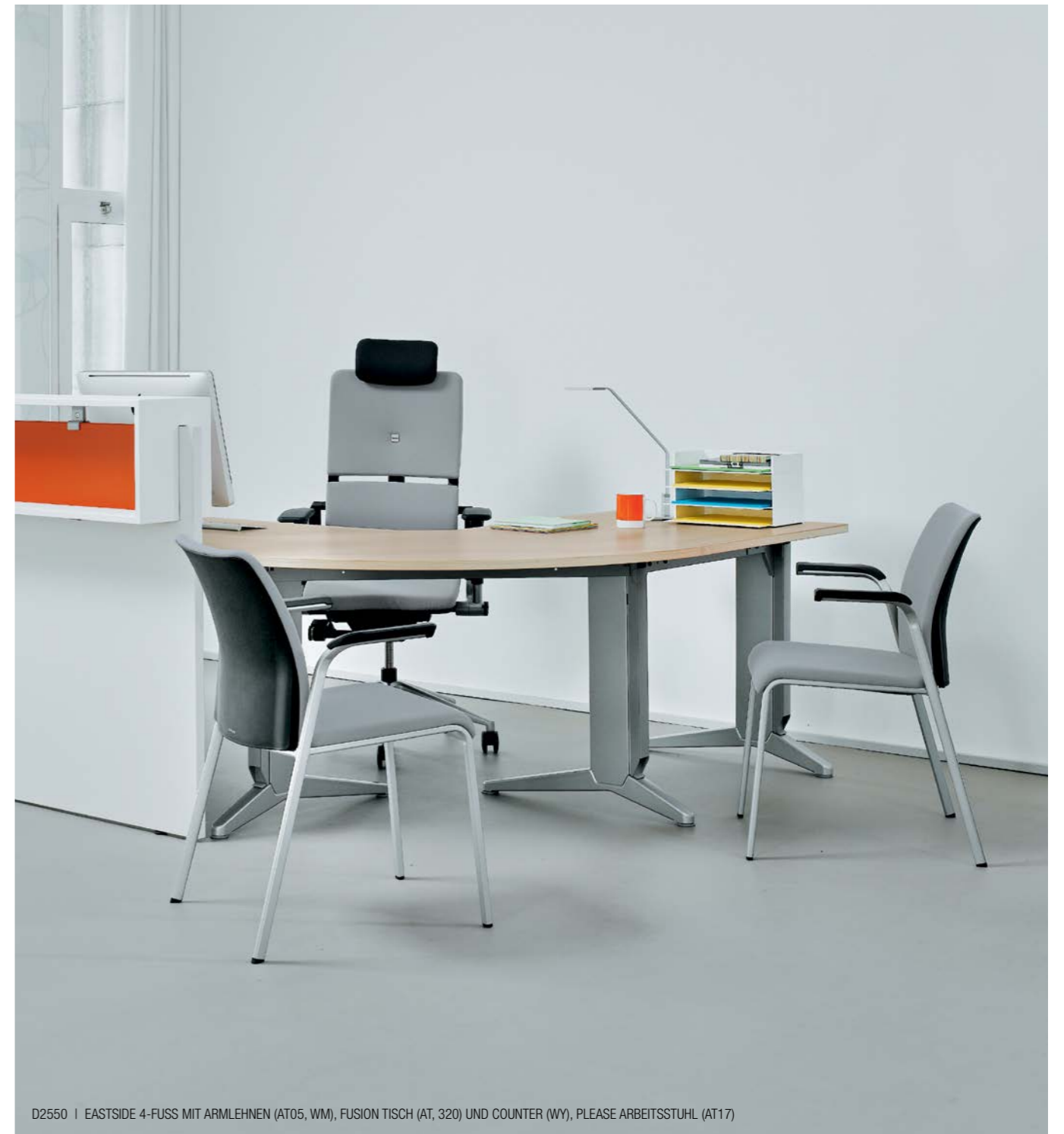
D2550 | EASTSIDE 4-FUSS MIT ARMLEHNEN (AT05, WM), FUSION TISCH (AT, 320) UND COUNTER (WY), PLEASE ARBEITSSTUHL (AT17)