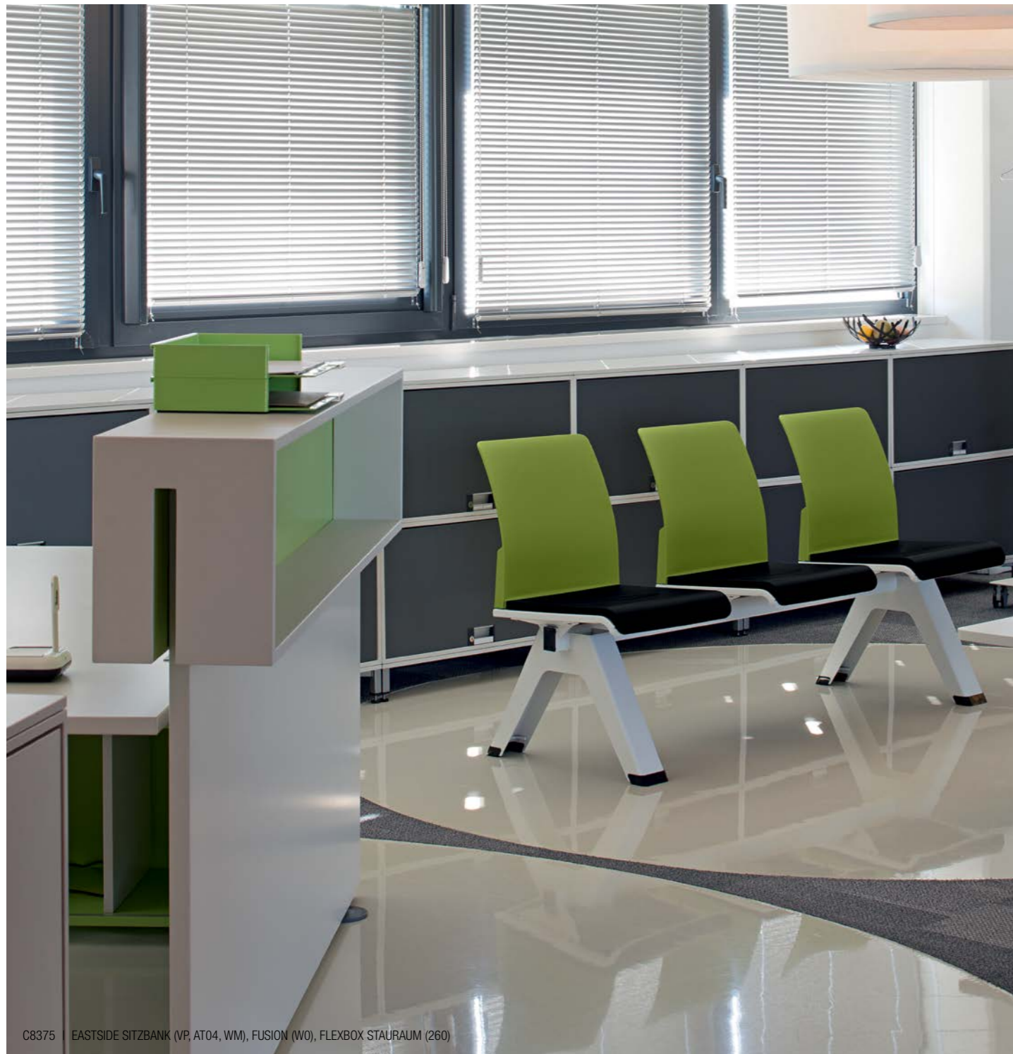
C8375 | EASTSIDE SITZBANK (VP, AT04, WM), FUSION (W0), FLEXBOX STAUHAUM (260)