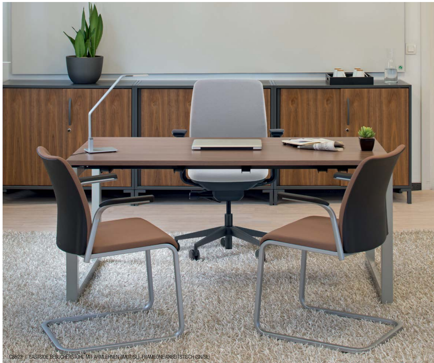
C8523 | EASTSIDE BESUCHERSTUHL MIT ARMLEHNEN (IM07/SL), FRAMEONE ARBEITSTISCH (SN/SL)

Eastside bietet in verschiedensten Arbeitsbereichen höchsten Komfort. Dieser Stuhl ist leistungsstark, vielseitig und dabei von ansprechender Optik. Diese flexible Sitzlösung lässt sich so gut wie überall einsetzen.