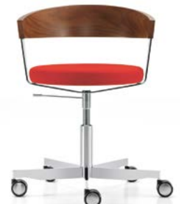
Drehstuhl mit Viersternfuss in Holz Siège de bureau avec piétement quatre branches en bois