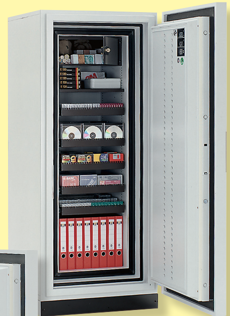
Datasafe S 14