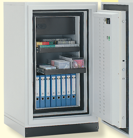
Datasafe SE 13