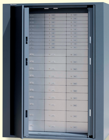
BWP 1902 avec compartiments bancaires