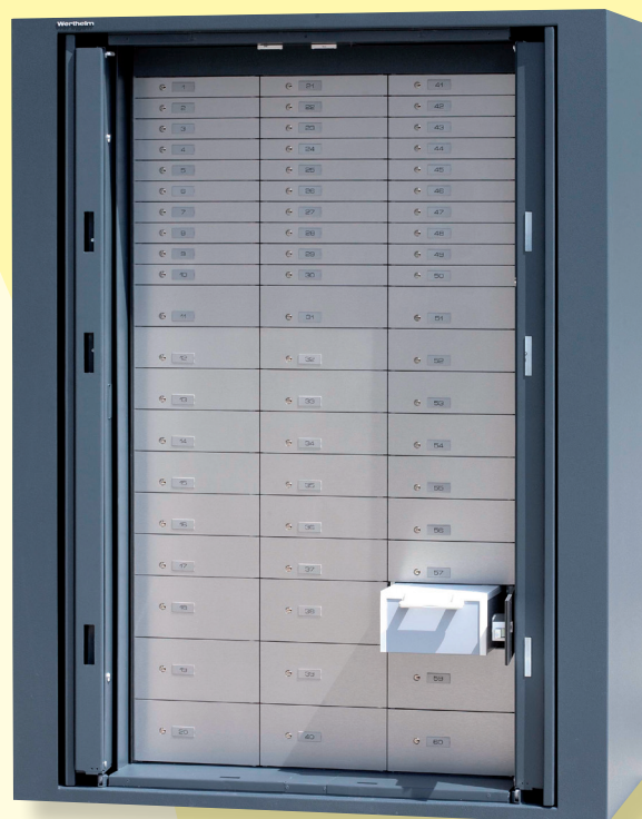
BWP 1902 avec compartiments bancaires