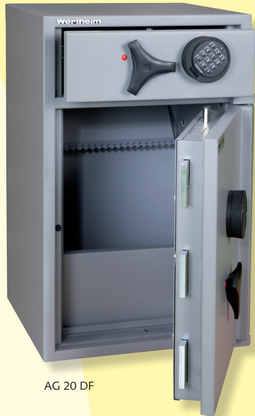
AG 20 DF