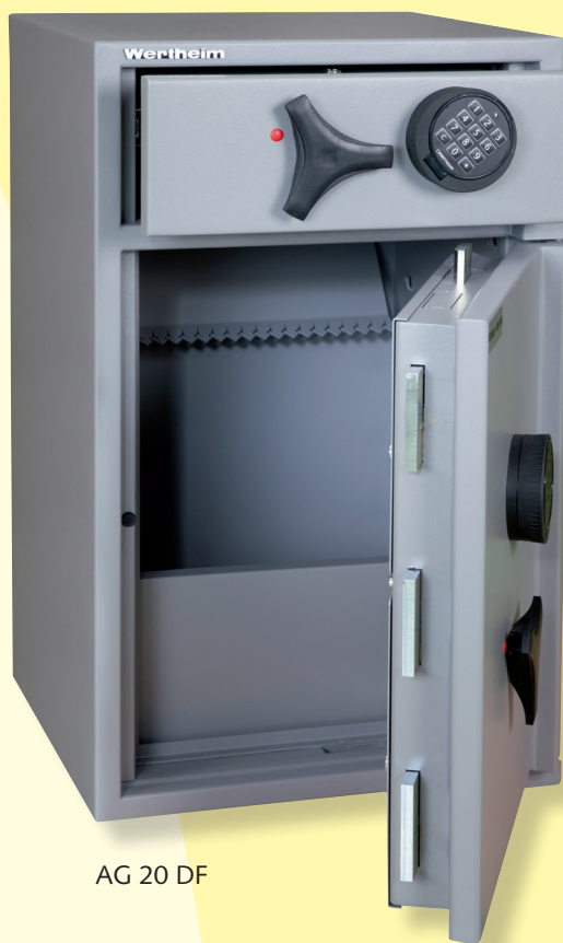
AG 20 DF