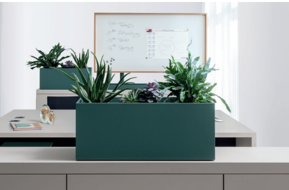
Pflanzkübel, B 72 | H 30 | T 36 cm