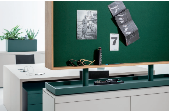
Pinnwand mit Tablett, B 120 - 180 | H 85/109 | T 24/36 cm